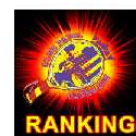
Figura 2-1: Entrada a la aplicación

Estimado eglblazquez, le enviaremos su contraseña a su correo electrónico.