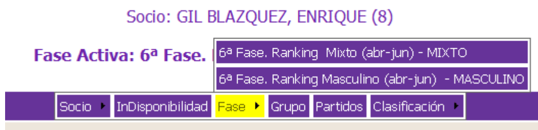
Figura 2-10: Menú Fase

En el caso de la figura 2-8, vemos que se muestran 5ª fase masculina y la 5ª fase Mixta. Dependiendo de la operación que vallamos a realizar, deberemos seleccionar una u otra. Es decir, si vamos a introducir un resultado de la fas mixta, pues debemos pinchar sobre esta para cargarla.