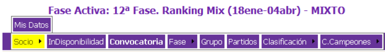
Figura 2-4: Menú Socio