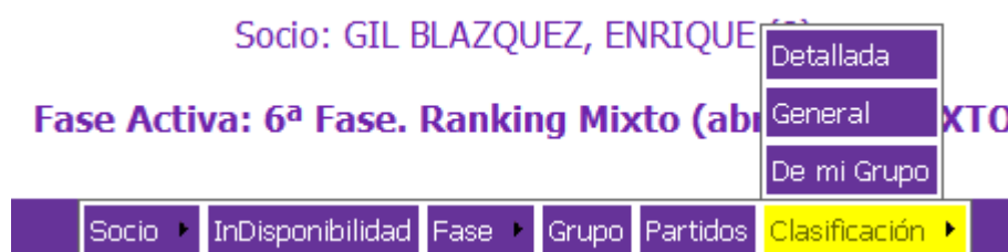
Figura 2-16: Menú Clasificación