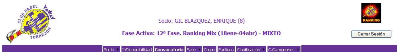
Figura 2-3: Menús de Control Ranking